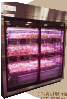
※写真は現行商品の LED 菜園 mini です

新鮮な採れたて野菜が 提供できる店内型 LED 菜園で、 店産店消はじめませんか？